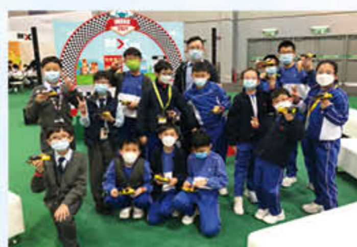
參加「夢工場 車的世界」STEM工作坊