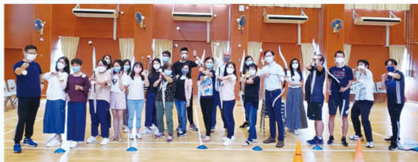
教師體驗「大戰攻防箭」活動，以培養團隊合作精神