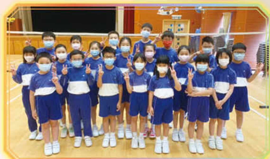
羽毛球隊榮獲青衣區小學校際羽毛球比賽女子團體賽亞軍