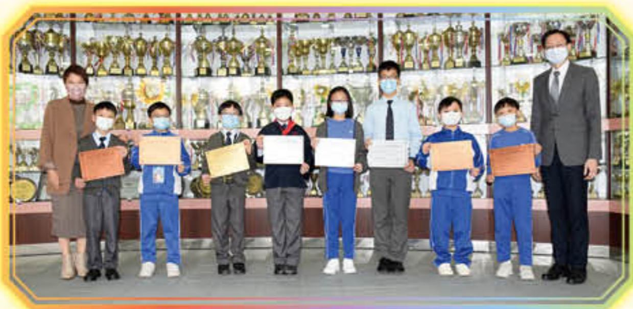
2021第二十八屆香港小學數學奧林匹克比賽