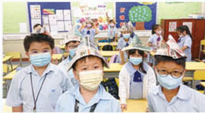
三年級學生在「創意」課堂中進行體驗活動