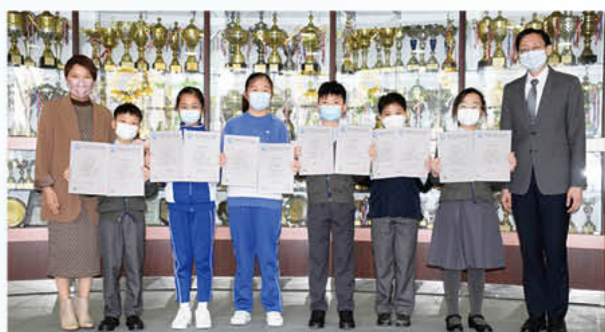
2021年秋季「世界數學及解難評估」中6名學生獲得「雙優生」的殊榮