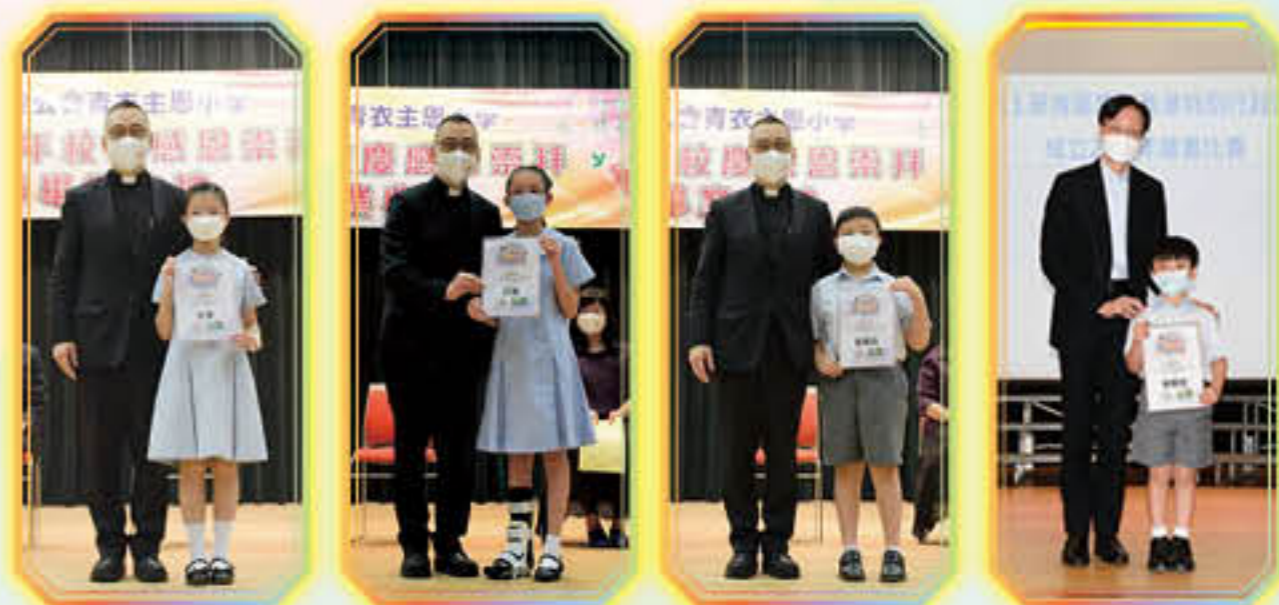
葵青區慶祝香港特別行政區成立25周年繪畫比賽