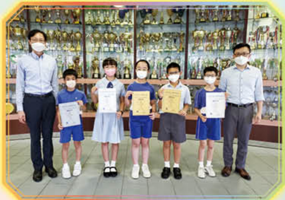
第三屆 世界STEM暨常識公開賽(複賽)