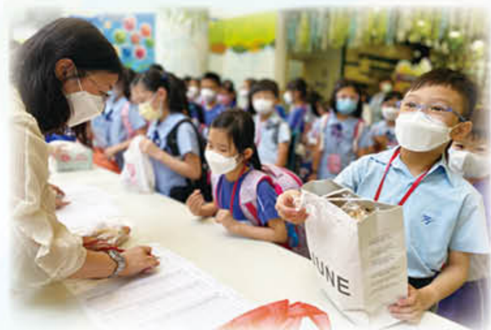
與惜食堂合辦的食品捐贈活動