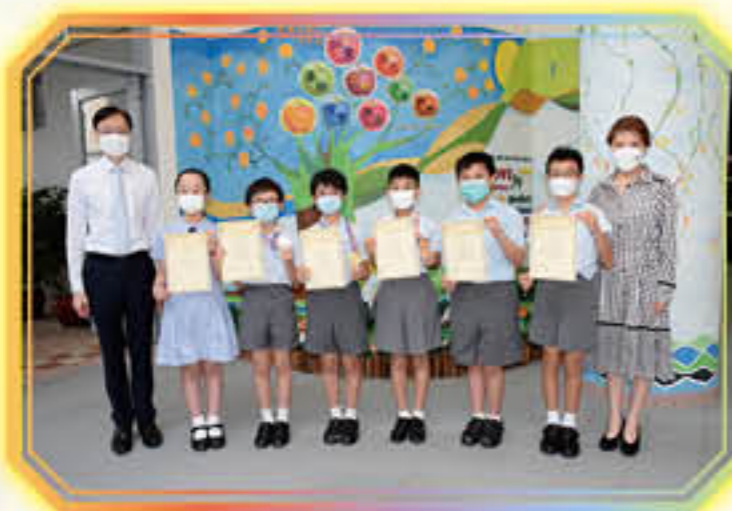
第八屆「全港小學數學挑戰賽」決賽

榮獲「大灣盃」粵港澳大灣區 數學競賽預選賽2022(香港賽區)一等獎、 選拔賽2022(大灣賽區)一等獎、 全國總決賽2022個人一等獎