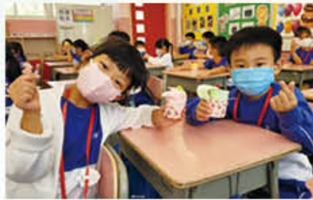
一年級學生製作「毛巾蛋糕」送給鄰近社區的長者，表現「仁愛」精神

此外，本學年獲得「優質教育基金」資助推行「我的行動承諾—感恩珍惜、積極樂觀」計劃。本計劃是由本校與聖雅各福群會Rachel Club合辦，透過主題分享、影片及體驗活動，讓學生學習如何運用樂觀的態度看待事情，對生活中發生的各項事情保持希望，鼓勵學生在日常生活中持續發揮品格強項。