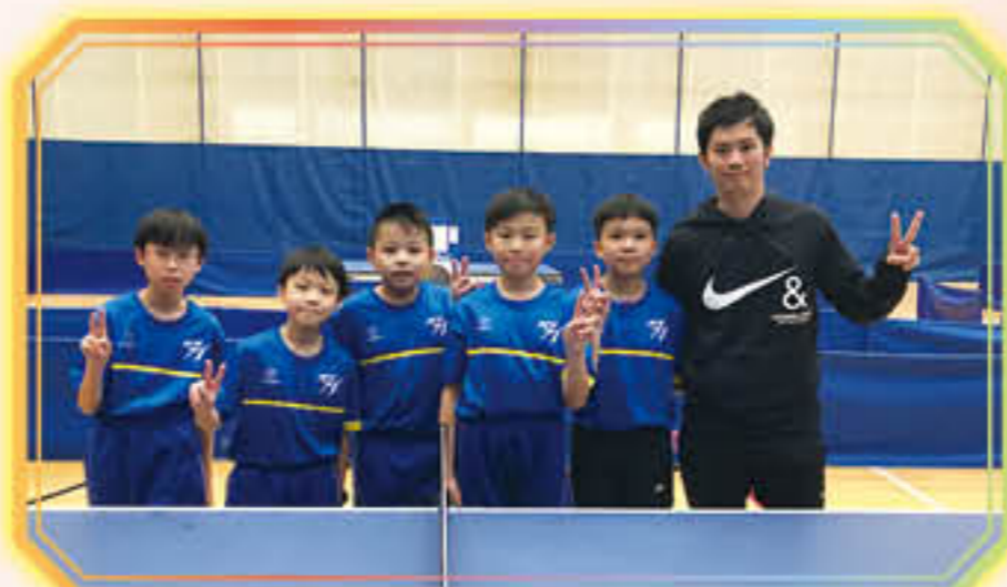
乒乓球隊榮獲青衣區小學校際乒乓球比賽男子團體賽冠軍