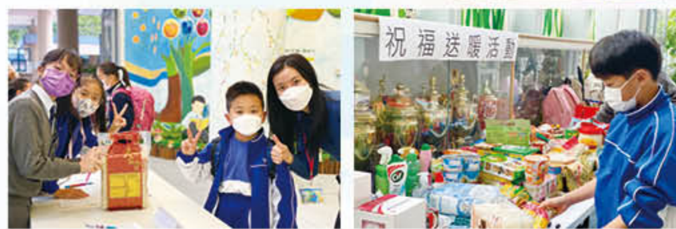
家長與學生積極參與「祝福送暖活動」捐贈活動