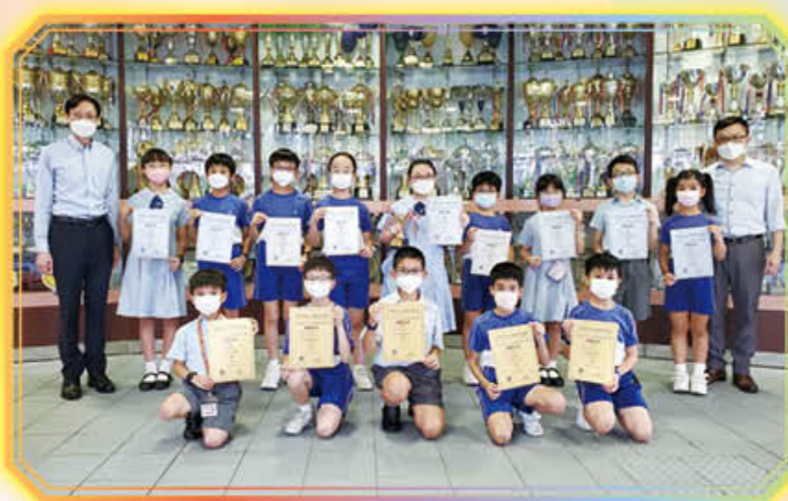
第三屆 世界STEM暨常識公開賽(初賽)小學四年級組榮獲團體季軍

榮獲賽馬會運算思維教育全港小學生運算思維比賽2022 最佳學科應用獎 (Scratch)