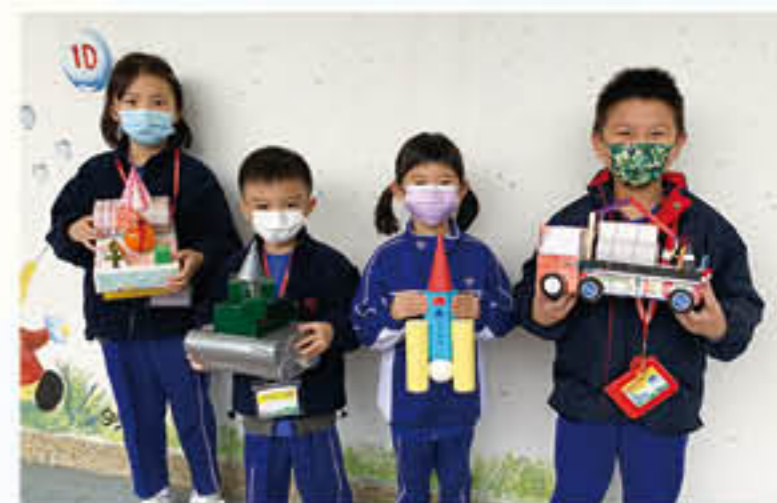
一年級學生運用生活中不同的立體廢料創作獨特的模型

同時，本校亦積極推動各級學生參加校外各項數學比賽及測試，屢獲殊榮。在多項的公開比賽中，取得個人雙優生、個人優等獎、個人一等獎、個人金獎等殊榮。