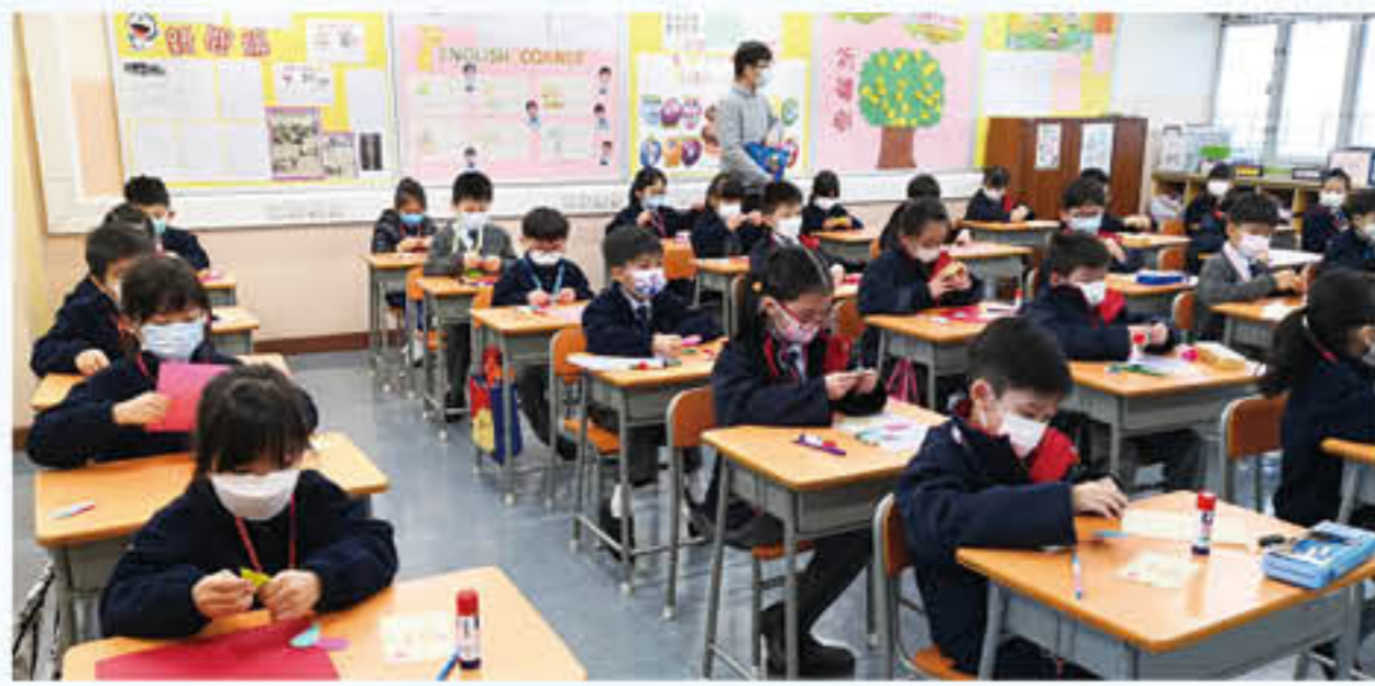
學生們專心製作「感恩卡」