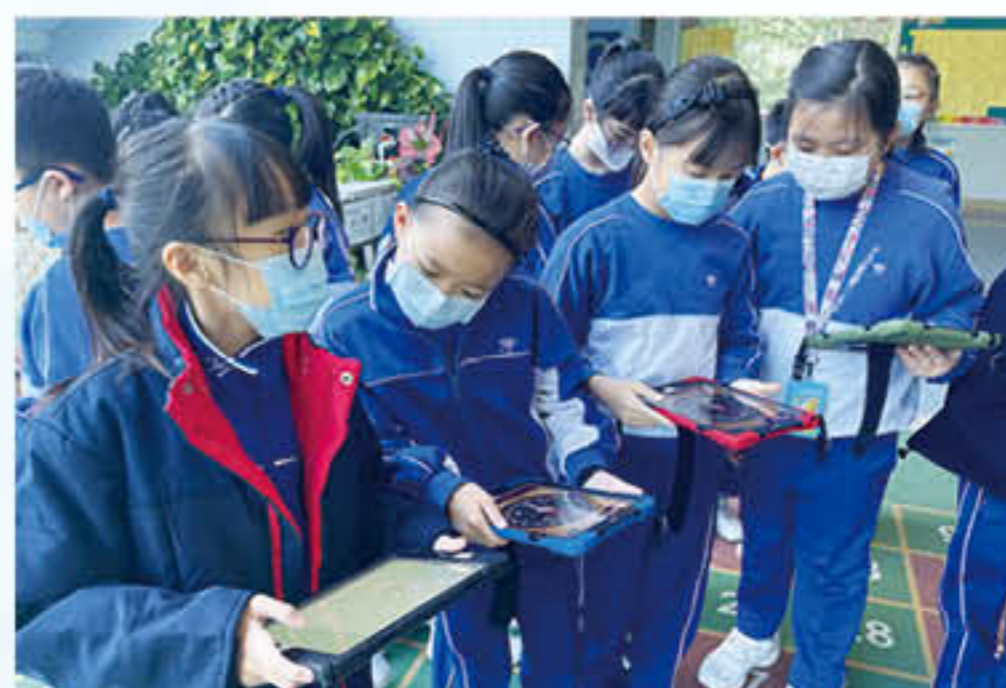
四年級學生運用iPad、Google Forms進行數學科全方位活動(方向)