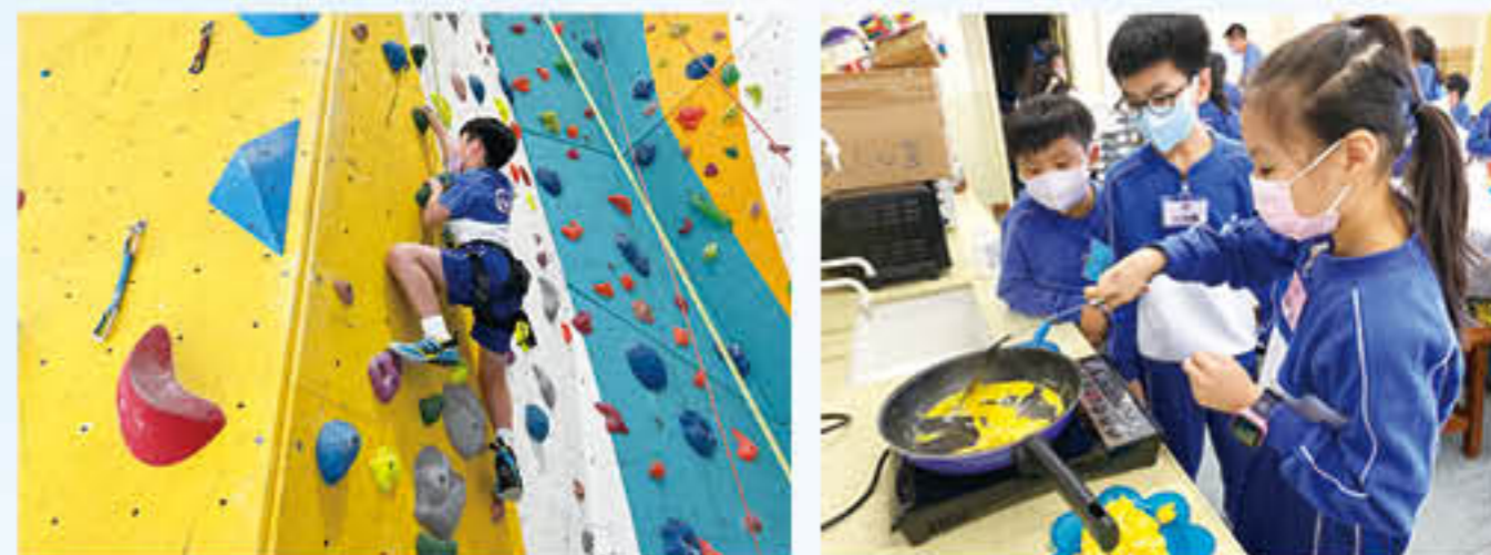
學生積極參與「成長的天空」計劃(小學)的各項抗逆活動

本校每年均申請「區本課後學習及支援計劃」及「校本課後學習及支援計劃」津貼，為一至六年級部份學生推行課後功課輔導班及多元化的興趣班，拓展學生潛能。