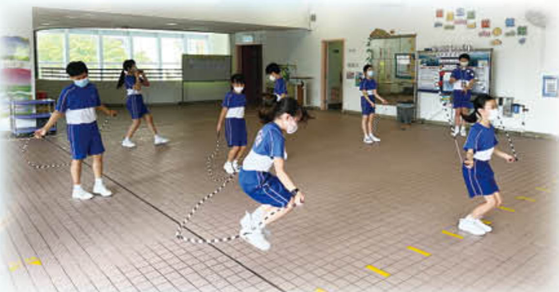
伴我啟航區本計劃推行的花式跳繩班