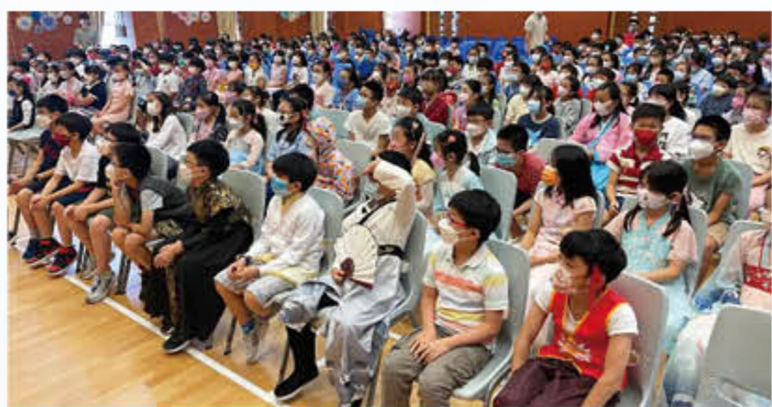
同學們都專注地欣賞普通話劇場。