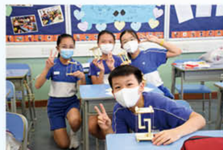
同學成功製作出張拉結構模型

培育學生的正向思維亦是本校常識科課程發展的重點。價值觀教育貫穿日常課程內容，從學生的生活經驗出發，培育學生關愛及尊重他人、富責任感、堅毅、守法、具同理心等正面的價值觀、態度和行為，達至全人發展。本年度課程以「感恩珍惜·積極樂觀」為主題，學生透過訂立個人發展計劃、海報設計等活動，建立積極正向的生活態度。