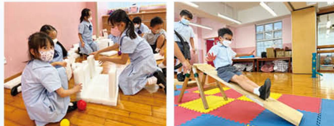
女青年會為一年級學生舉行「共建社區遊樂場」活動

此外，透過參加聖公宗(香港)小學監理委員會屬校學生輔導主任及聖公會小學輔導服務處舉辦之聖公宗小學「生命、心靈及價值教育」計劃之「童放正能量」聯校親子活動比賽，促進親子關係。