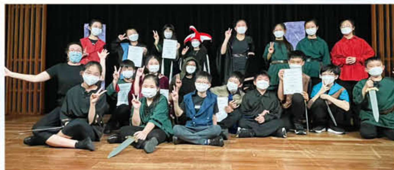
小莎翁青少年莎士比亞戲劇培訓計劃

學生在豐富的語言環境下將已有的知識活學活用，本年度英文科舉辦了多元化的英語活動，如Journey Through the Classics Reading Activities, English Speaking Competition, 'My Beloved TYCY' Writing Competition及以宣揚正向教育「24個品格強項」為主題的Comic Strip Writing Competition等。為擴闊學生對英語世界熱門話題的認識、加強師生互動交流及營造最佳的語境，外籍英語老師亦於早上時段進行Breakfast with Mr. Mitch活動。另一方面，本年度五年級學生參加由香港小莎翁Shakespeare4All舉辦的「小莎翁青少年莎士比亞戲劇培訓計劃」'Transformation Through Creativity'話劇訓練，以鼓勵學生閱讀及探索更多有關莎士比亞的作品，並選出學生參加戲劇工作坊。此外，本年度四至六年級學生於下學期亦參加了「抽離式資優語文課程：英文辯論」，此課程訓練學生邏輯、口才與說話技巧，並培養學生分析問題、解決問題的能力。