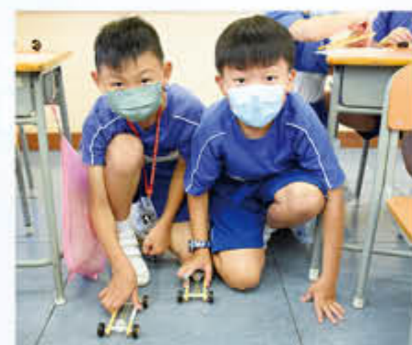
同學準備用自己完成的橡皮筋動力車進行比拼