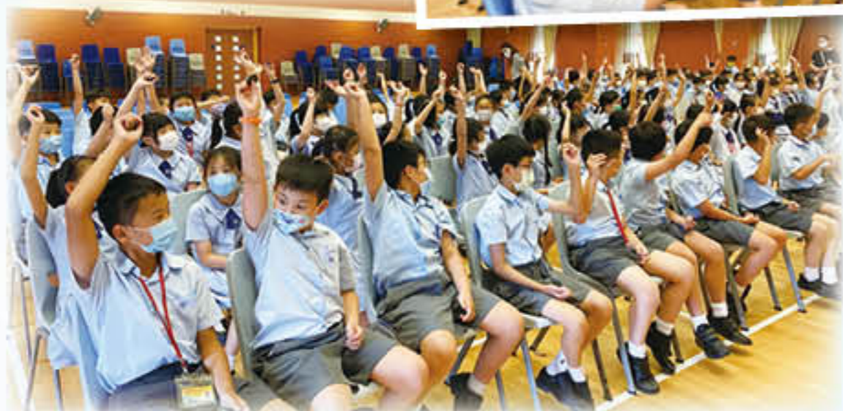
四年級「成長的天空」宣傳活動