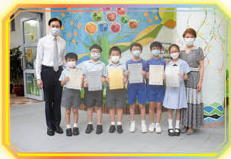
2022亞洲國際數學奧林匹克公開賽晉級賽(AIMO Open)