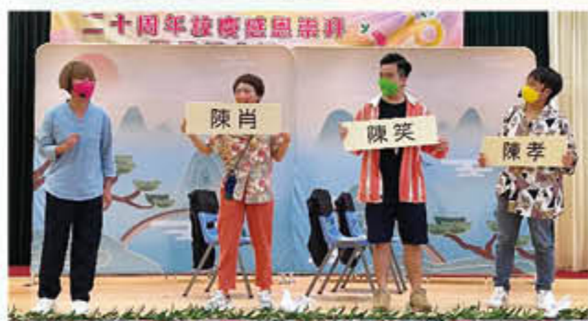
本年度舉辦的普通話劇場 — 醫生在線

本校學生積極參與各項普通話比賽和公開考試，並獲得優異成績，雖然因疫情影響令多項比賽取消，但本校學生在第73屆校際朗誦節中仍取得不少獎項，包括獨誦冠軍5項、亞軍6項，季軍10項、優良獎41項。本年度共有34名學生參加了國際教育研究中心舉辦的「少兒普通話水平測試」，並取得19優11良的優良成績；另外，有12名學生參加北京大學舉辦的「GAPSK港澳地區中小學普通話水平測試」，並取得卓越的成績。