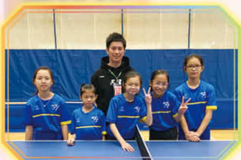
乒乓球隊榮獲青衣區小學校際乒乓球比賽女子團體賽冠軍