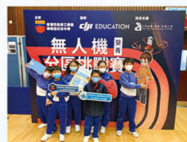
同學參與「無人機分區挑戰賽」，成績優異