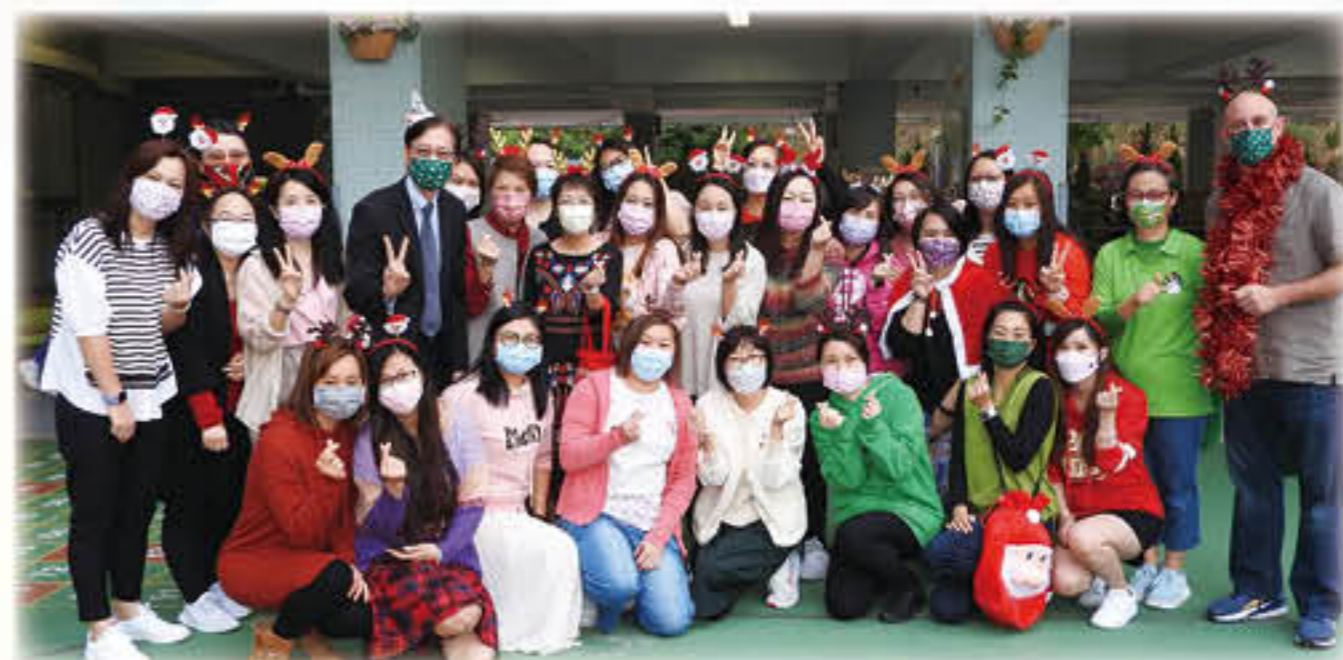
「English Fun Day」家長義工

家長教師會是學校的忠誠伙伴，並積極發揮家校之間的橋樑作用，本年度在家教會的協助下，雖然疫情反覆，學校仍舉辦了兩次興趣班及三次網上家長講座。家長義工積極協助「English Fun Day」、「中華文化便服日」、家長興趣班及二十周年校慶活動等，大大促進了家校之間的情誼及合作精神。