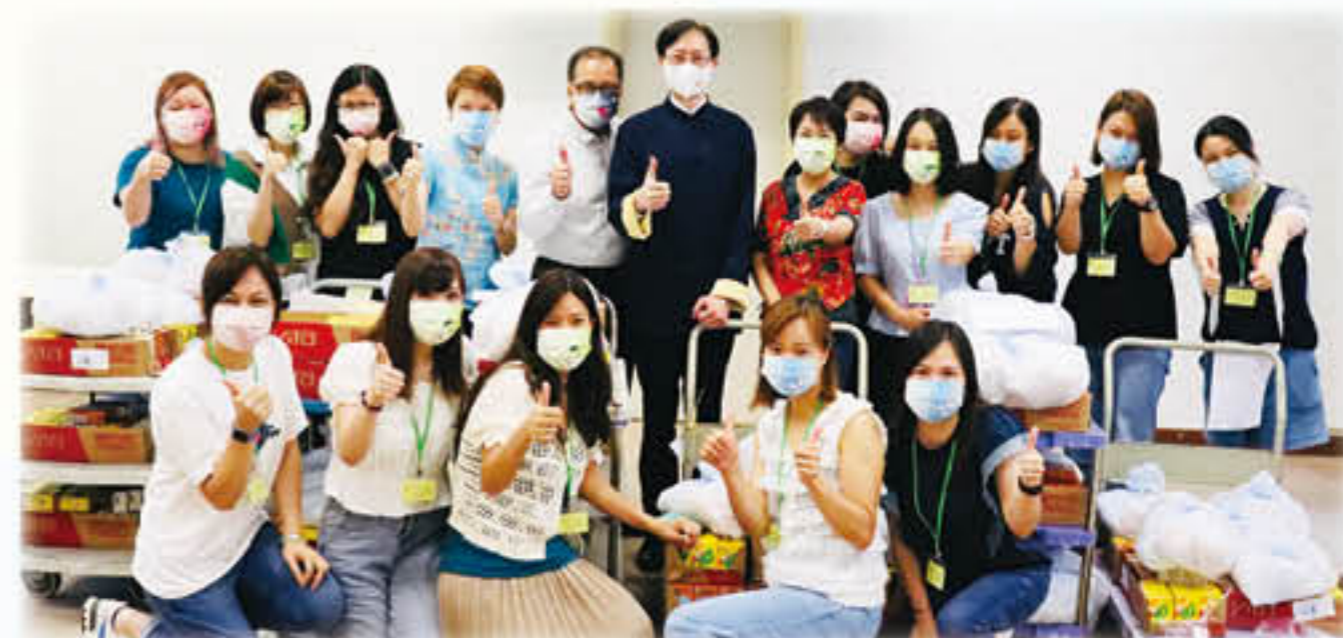
中華文化便服日家長義工