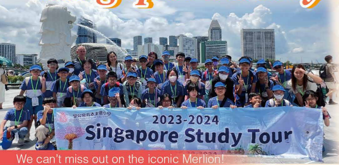
We can't miss out on the iconic Merlion!