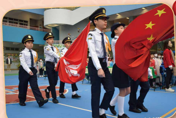
活動由升旗禮掀起序幕，升旗隊隊員精神抖擻，英姿煥發。