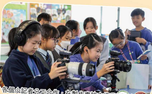
各個小記者分工合作，在製作專訪中擔當不同角色。