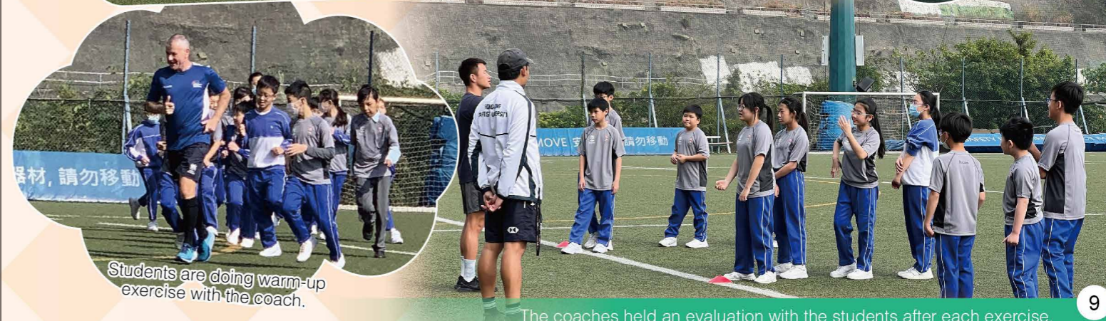
Students are doing warm-up exercise with the coach.