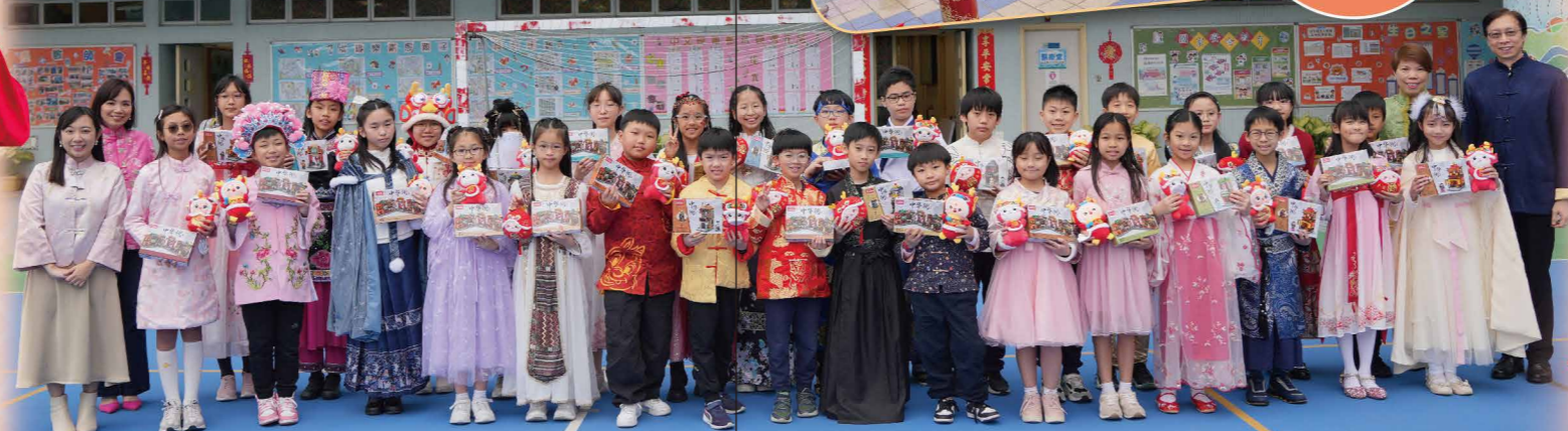
校長與中華文化服飾選舉得獎同學合照，留下倩影。