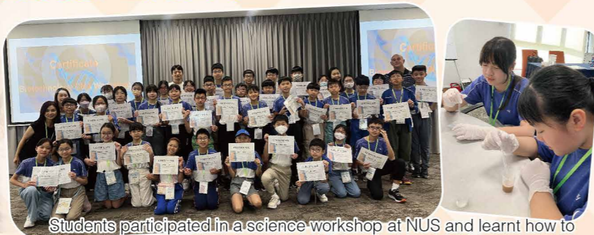
Students participated in a science workshop at NUS and learnt how to extract the DNA from fruit.