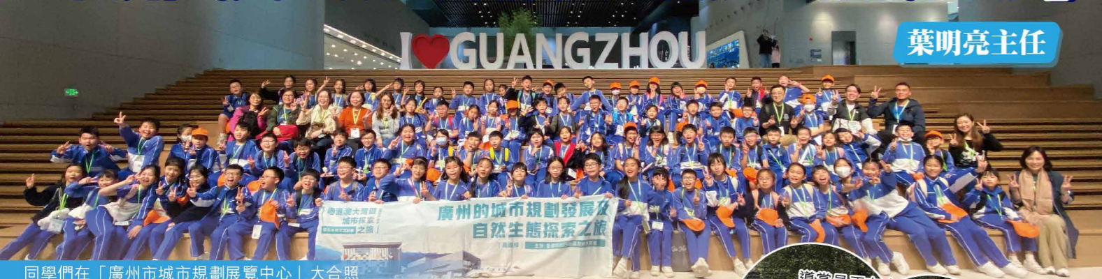
同學們在「廣州市城市規劃展覽中心」大合照

二零二四年三月十五日，本校四年級師生共百多人乘坐高鐵參加「廣州的城市規劃發展及自然生態探索之旅」。同學們懷著既好奇又興奮的心情乘坐高鐵，讚歎高鐵的速度非常快，而且車廂環境舒適。參觀完中國科學院華南植物園及廣州市城市規劃展覽中心後，師生都對自然與城市的關係有了更深入的了解。