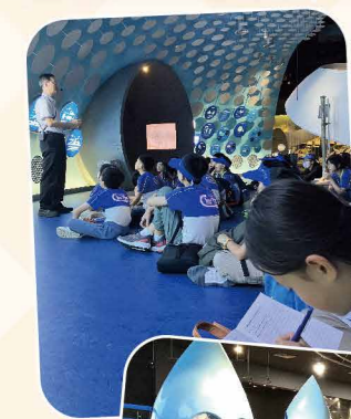
Students gained insights into Singapore's innovative approaches to urban planning after the visit to Marina Barrage. They hope to contribute to our country in the future.

Throughout the trip, our students gained insights into Singapore's innovative approaches to urban planning and sustainable development. As the study trip drew to a close, students reflected on the invaluable knowledge gained, lifelong friendships formed, and memories made in this remarkable city-state.