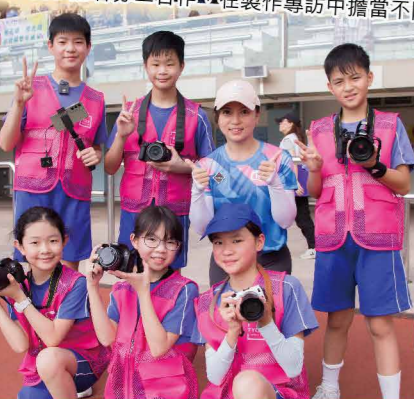
部分小記者學員組成 TYCY MEDIA TEAM，於本校校運會當日協助拍攝，學以致用。