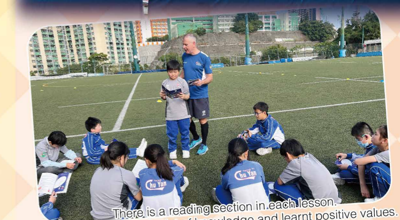
There is a reading section in each lesson. Students acquired a lot of knowledge and learnt positive values.