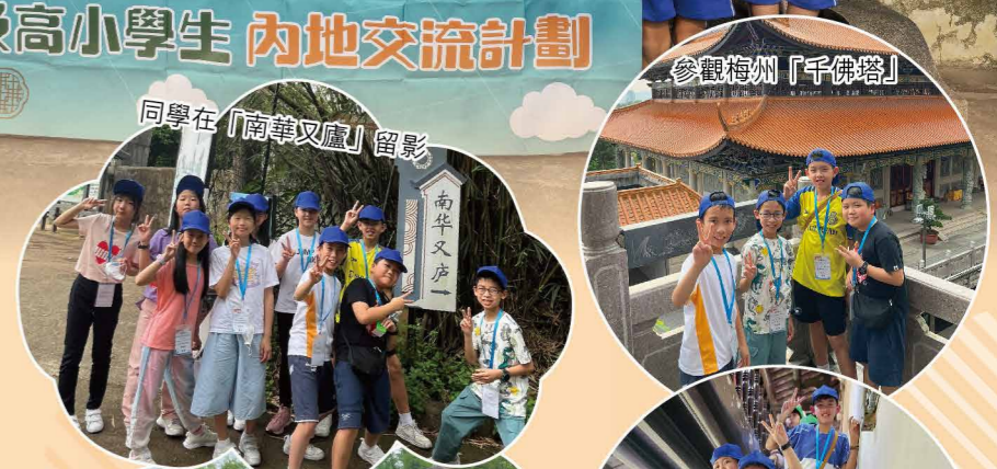
同學在「南華又廬」留影

經過三日兩夜的境外學習交流活動，學生可全面認識中國客家文化的發展歷史及客家人士的遷徙過程，加深對中華文化的認識，實在難得。