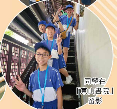
同學在「東山書院」留影