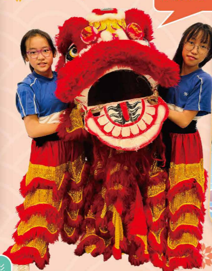
醒獅隊隊員一招一式，有板有眼。