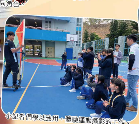
小記者們學以致用，體驗運動攝影的工作。