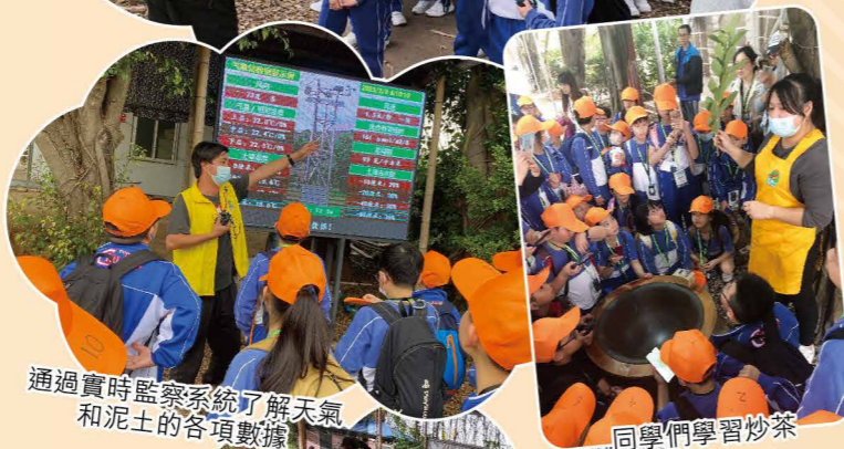
通過實時監察系統了解天氣和泥土的各項數據