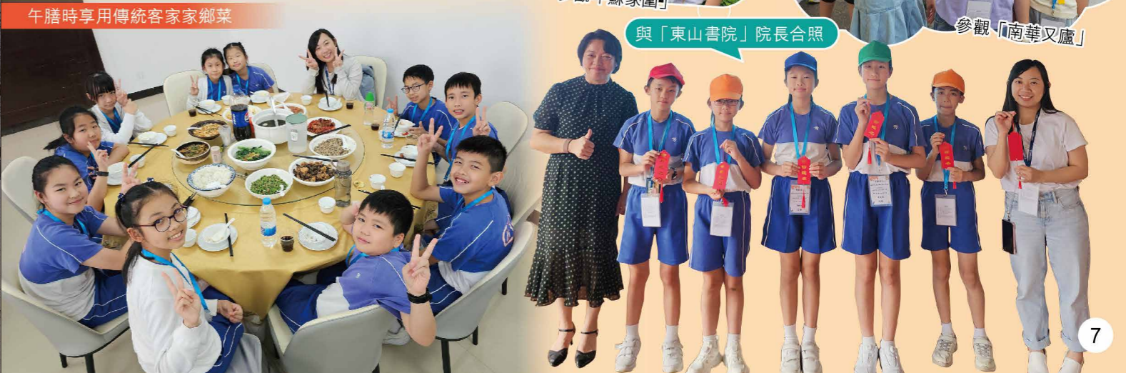
午膳時享用傳統客家鄉菜