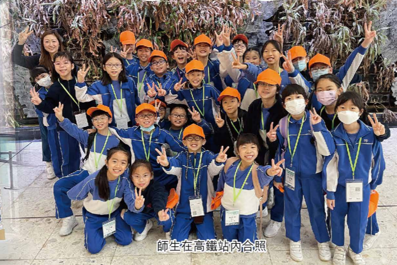
師生在高鐵站內合照