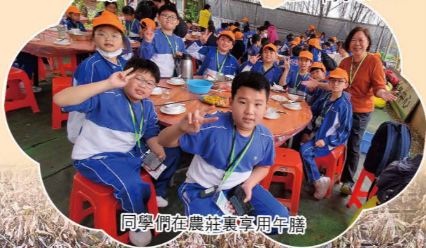
同學們在農莊裏享用午膳