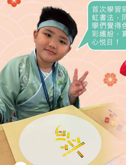
首次學習彩虹書法，同學們覺得色彩繽紛，賞心悅目！

活動當天，同學們踴躍參與各項活動，發揮潛能，盡展所長。當天各項活動得以順利完成，除了有賴老師的細心籌劃外，更要多謝家長義工的積極協助，讓學生能在充滿中華文化的氛圍下，寓學於樂。相信師生們都從是次活動中認識到中華文化源遠流長的歷史內涵，體會到中國古代智慧的獨特魅力，希望「中華文化便服籌款綜合活動日」能引起同學對研習中國傳統文化的興趣，促進中華文化傳承。