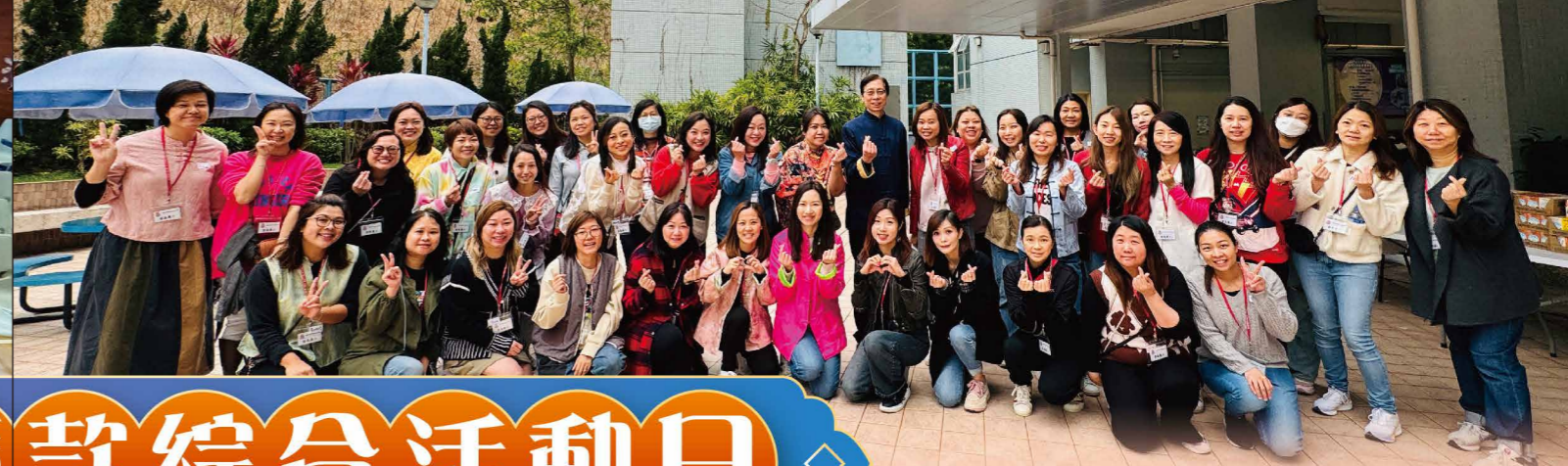
衷心感謝家長義工的協助，活動才得順利進行。