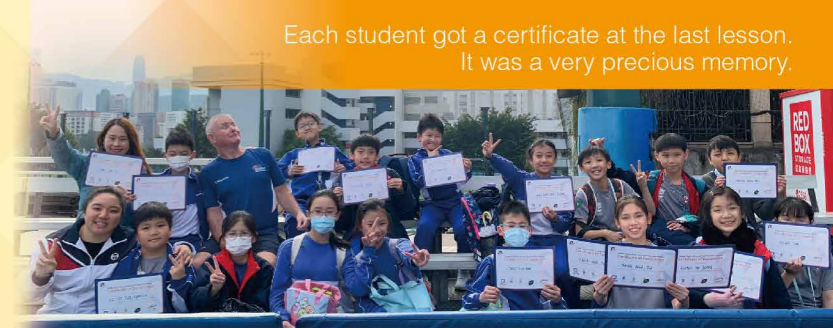
Each student got a certificate at the last lesson. It was a very precious memory.

Starting from 5th January, 2024, for four consecutive Fridays, our students participated in the English Rugby Active Learning organized by the Standing Committee on Language Education and Research (SCOLAR), giving them a first taste of rugby. 20 students were led by teachers to the King's Park Rugby Stadium for activities. This activity was taught in English by professional foreign coaches from the Hong Kong Rugby Association. Students were exposed to English in a new way, thereby learning more English vocabulary and enhancing their confidence in using English. Throughout the entire programme, students used English while learning the rules and basic skills of rugby, which greatly enhanced their interest in learning English and sports. In addition, students learnt positive values through activities, including teamwork, respect and self-discipline.