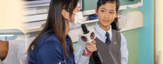
小記者在訪問前搜集受訪者的資料，提出不同角度的問題，增加訪問的趣味。