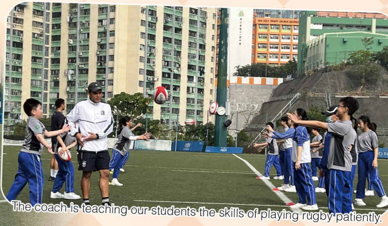
The coach is teaching our students the skills of playing rugby patiently.