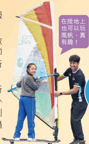
在陸地上也可以玩風帆，真有趣！