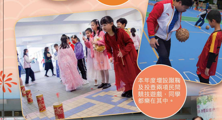
本年度增設蹴鞠及投壺兩項民間競技遊戲，同學都樂在其中。

活動當天，同學們踴躍參與各項活動，發揮潛能，盡展所長。當天各項活動得以順利完成，除了有賴老師的細心籌劃外，更要多謝家長義工的積極協助，讓學生能在充滿中華文化的氛圍下，寓學於樂。相信師生們都從是次活動中認識到中華文化源遠流長的歷史內涵，體會到中國古代智慧的獨特魅力，希望「中華文化便服籌款綜合活動日」能引起同學對研習中國傳統文化的興趣，促進中華文化傳承。