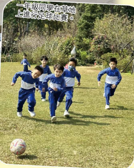
一年級同學在草地上進行足球比賽。