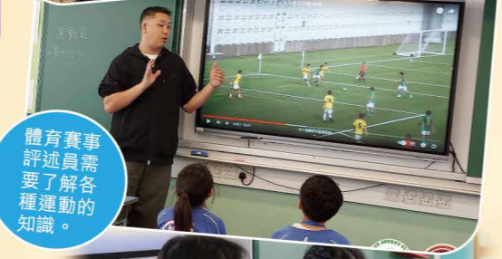
體育賽事評述員需要了解各種運動的知識。