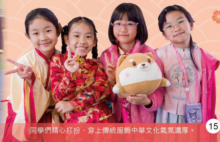
同學們精心打扮，穿上傳統服飾中華文化氣氛濃厚。