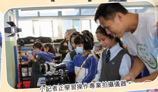
小記者正學習操作專業拍攝儀器。