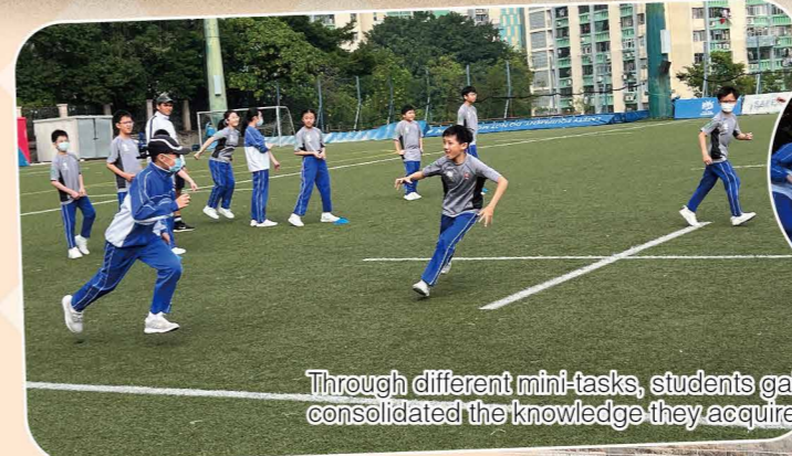
Through different mini-tasks, students gained the mastery of the skills and consolidated the knowledge they acquired during the programme.