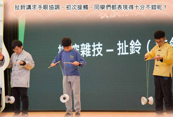
扯鈴講求手眼協調，初次接觸，同學們都表現得十分不錯呢！