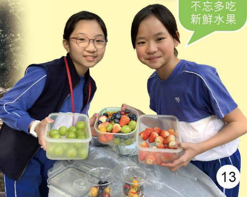
燒烤期間也 不忘多吃 新鮮水果