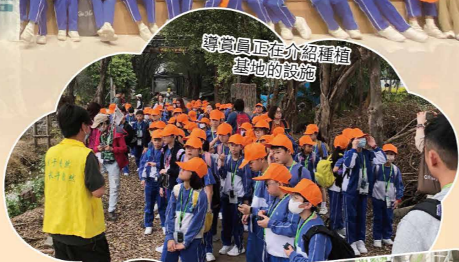
導賞員正在介紹種植基地的設施

這次參觀不僅豐富了同學的知識，更啟發了他們對環境保護和城市建設的興趣。我們相信，這樣的學習經歷將會對他們未來的成長和發展產生積極的影響，使他們成為更有社會責任感的公民，熱愛自然，關心城市，為建設美好的家園作出貢獻。