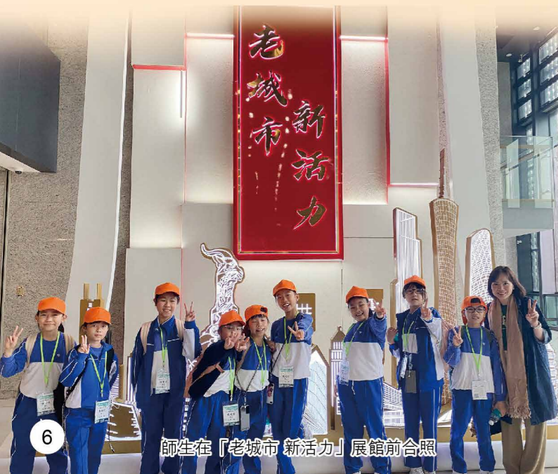
師生在「老城市新活力」展館前合照