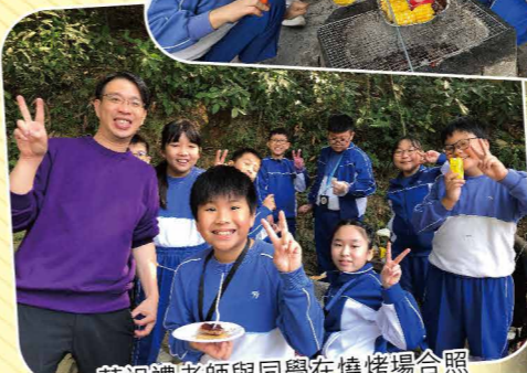
葉祖禮老師與同學在燒烤場合照