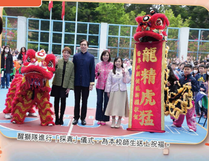
醒獅隊進行「採青」儀式，為本校師生送上祝福。