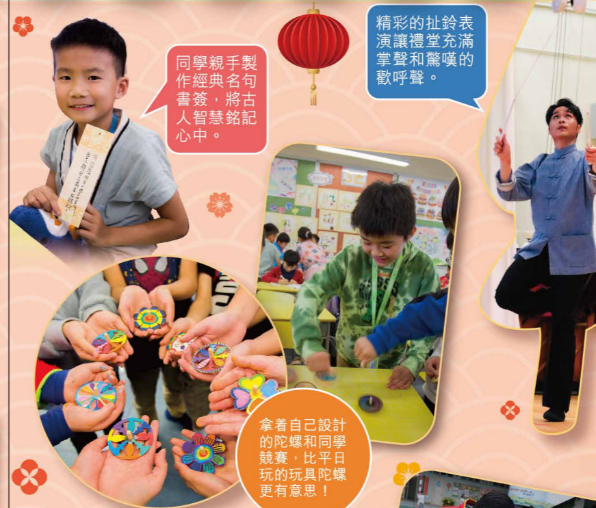
同學親手製作經典名句書籤，將古人智慧銘記心中。