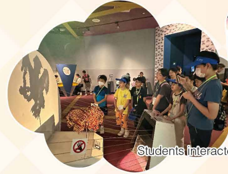
Students interacted with interesting displays at the Science Museum.