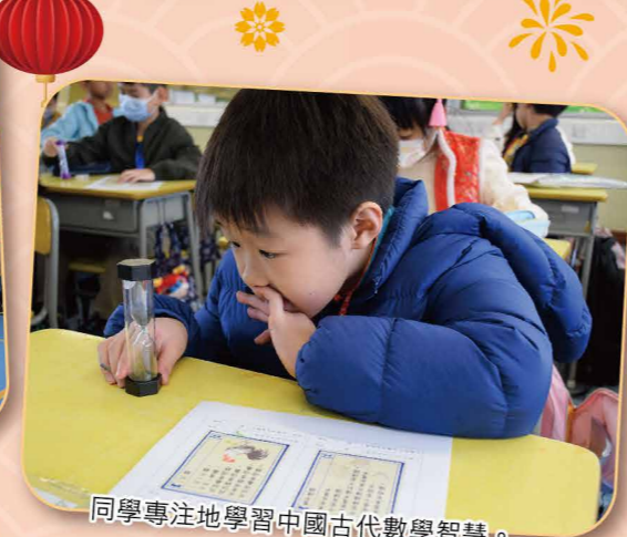
同學專注地學習中國古代數學智慧。