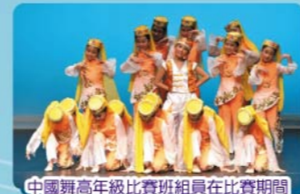
中國舞高年級比賽班組員在比賽期間展露活潑可愛的笑臉