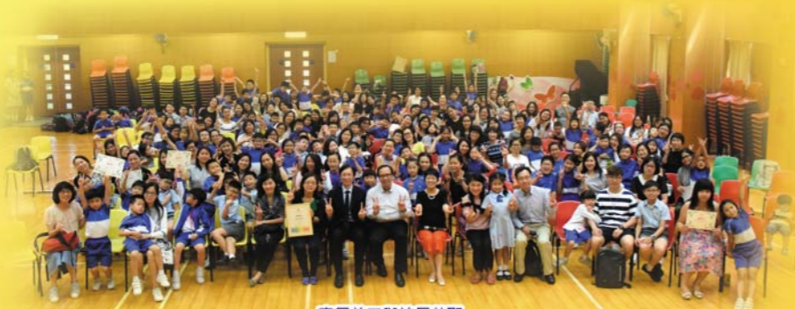
家長義工與校長茶聚

家長教師會是學校的忠誠伙伴，並積極發揮家校之間的橋樑作用，本年度在家教會的協助下，學校舉辦了「闔家歡聚樂悠遊」大旅行。本校家長義工隊陣容鼎盛，亦積極投入各項學校義務工作，當中包括校運會、「校服回收顯關懷」、「中華文化便服日」活動、各科組學習活動、家長閱讀大使、故事姨姨、午膳媽媽及家長興趣班義工等，大大促進了家校之間的情誼及合作精神。本年度家長義工團隊更榮獲聖公會福利協會義工獎勵計劃之「團體關懷獎」，更肯定了家長義工的積極投入及熱誠參與。