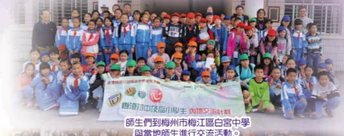
學生們正在進行科技活動比賽，看誰的動力車跑得最快最遠！

為了擴闊學生的學習視野，本年度舉辦了「廣東梅州客家文化一考察之旅」，目的是讓學生了解客家的起源、歷史發展、風俗習慣及傳統文化，從而認識和體會客家尚文重教的傳統精神。