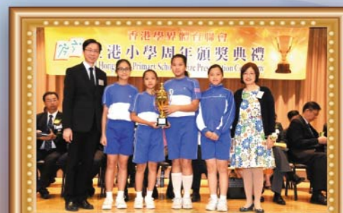
香港學界體育聯會青衣區小學總錦標女子組金獎