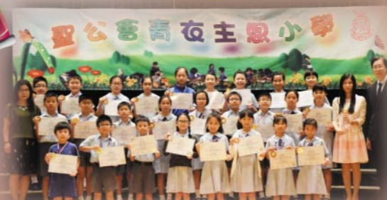
2016「奇幻之旅」繪畫比賽(亞太區)勇奪學校組冠軍、 兒童組一等獎2名、二等獎3名、三等獎1名 少年組一等獎3名、二等獎2名、三等獎8名及優異獎6名