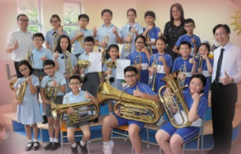
銅管樂小組榮獲香港聯校音樂協會 「聯校音樂大賽2017」兩項金獎佳績