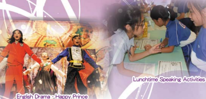
English Drama - Happy Prince

為了讓學生在豐富的語言環境下將已有的知識活學活用，本年度英文科舉辦了多元化的英語活動，如「Drama Shows」、「Reading Wonderland Activities」、「Lunchtime Speaking Activities」、「Creative Writing Competition」、「Comic Strip Writing Competition」等。為擴闊學生對熱門英語世界話題的認識、加強師生互動交流及營造最佳的語境，英文科於本年度亦出版了三份內容豐富的科本刊物「TYCY Smarties」。