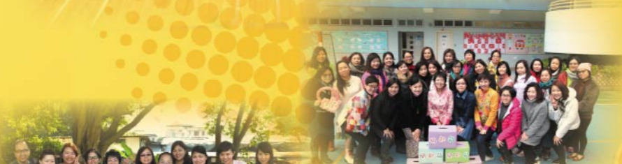
中華文化便服日家長義工團隊