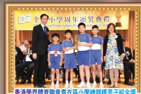
香港學界體育聯會青衣區小學總錦標男子組金獎