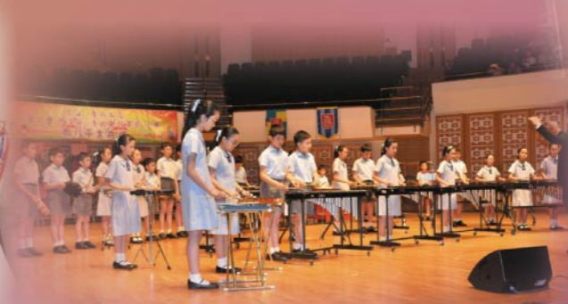
敲擊樂隊榮獲校際音樂節敲擊樂高級組季軍