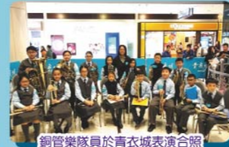
銅管樂隊員於青衣城表演合照