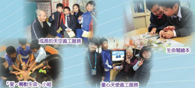
成長的天空義工服務