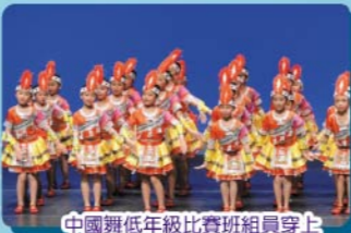
中國舞低年級比賽班組員穿上鮮艷奪目的民族服裝