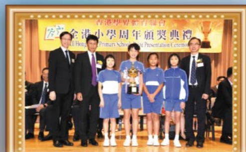
香港學界體育聯會青衣區小學總錦標女子組九連冠金獎