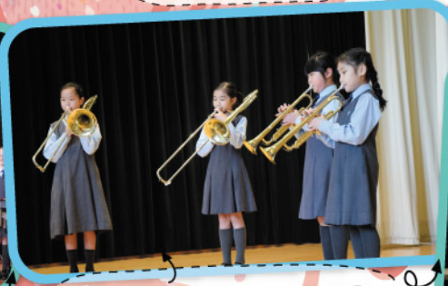
校內復活節崇拜中音樂表演節目： 敲擊樂、銅管樂、合唱團