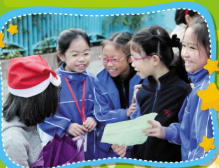
Let's interview as many teachers as we can to find all the Santa Clauses!