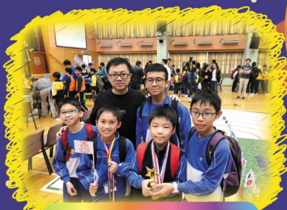
同學們在第六屆聖公會小學聯校機械人冬季奧運會表情出色