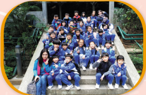
三年級同學在動植物公園留下歡欣的一刻