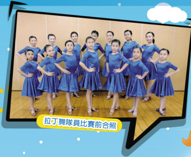
拉丁舞隊員比賽前合照