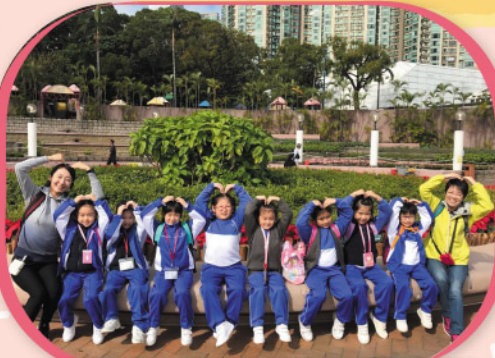
一年級同學參觀九龍公園時留下的歡欣笑臉

本校於2017年12月14日為全校學生安排一天戶外學習日，目的是讓學生跑出課室，從真實環境中學習，並透過親身體驗和探究活動，培養學生自主學習的精神。本年度師生到訪不同的地方，例如到九龍公園認識雀鳥、植物及公園的各種設施；到香港文化博物館認識粵劇中各式各樣的戲服和道具，以及金庸先生的生平和為人熟悉的著作；到香港動植物公園學習有關動植物的知識；到香港歷史博物館認識香港的歷史和傳統文化；到沙田污水處理廠、新界西堆填區及零碳天地學習環保和愛惜資源的重要；到濕地公園學習濕地知識和欣賞各種濕地生物的美態。本校相信多元化的戶外學習活動，能提升學生的學習興趣，擴闊學生的學習視野，鼓勵學生探索新的知識。