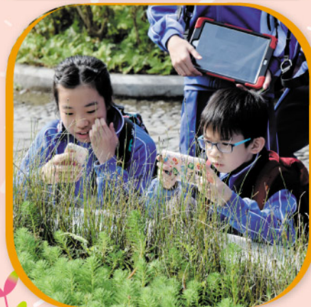
六年級同學正運用IPAD找尋濕地公園內的動植物