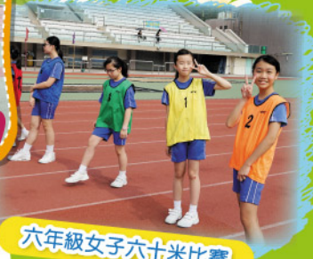
六年級女子六十米比賽