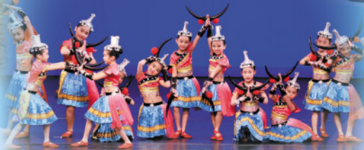
低年級中國舞隊(牛角娃)榮獲「優等獎」