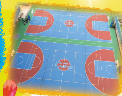
重新粉飾的籃球場