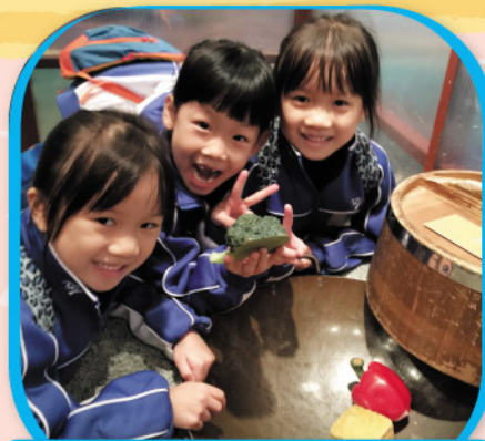
二年級參觀香港文化博物館的兒童探知館