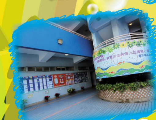
煥然一新的魚池樓梯壁畫