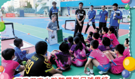
同學們專心聆聽曼聯足球學校 總教練奧拜恩的講解