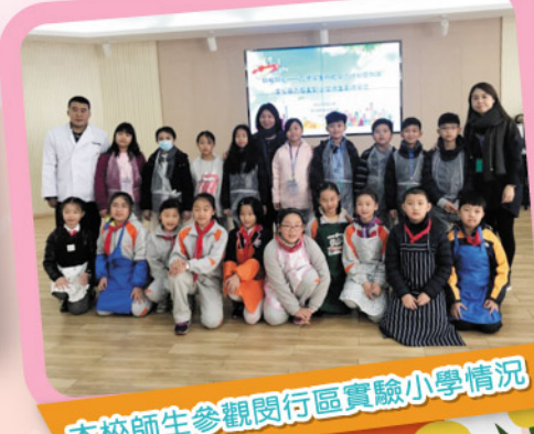
本校師生參觀閔行區實驗小學情況