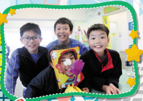
Oh My God! I got slapped!