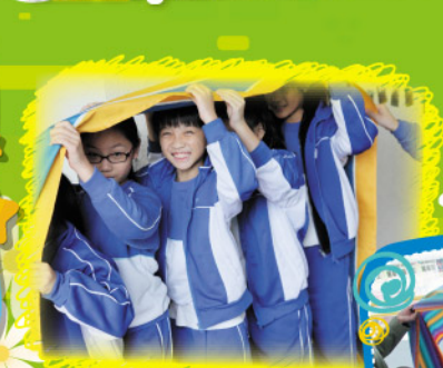
The Christmas English Fun Day is really fun!