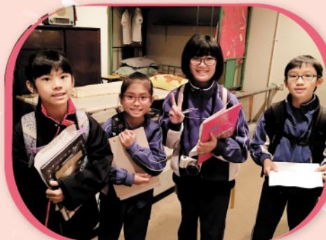
四年級同學在歷史博物館參觀昔日市民的居住環境