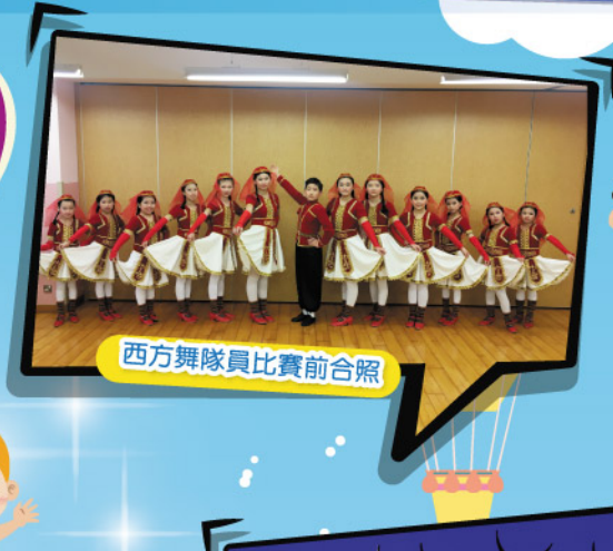
西方舞隊員比賽前合照