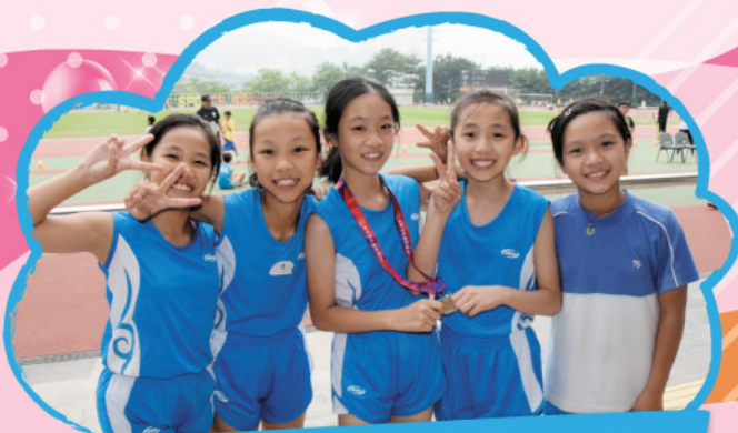
女子組運動員團結一致