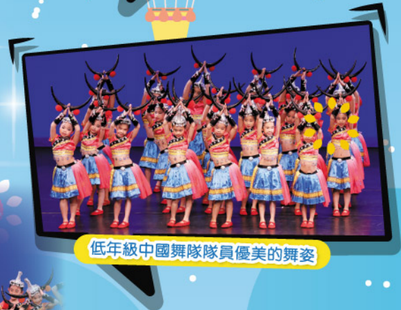
低年級中國舞隊隊員優美的舞姿