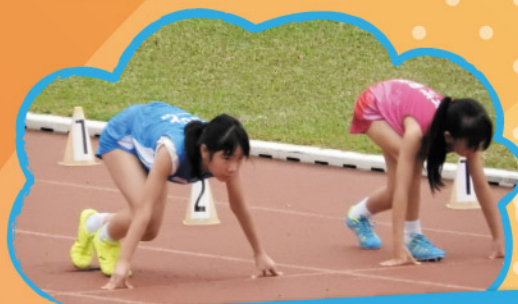
訓練有素的起跑姿勢