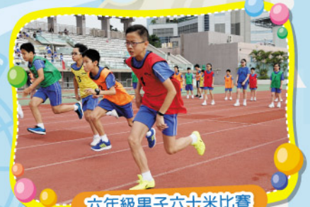
六年級男子六十米比賽