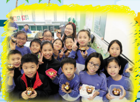
Oh! The cooking class is great! Look at our reindeer cupcakes!