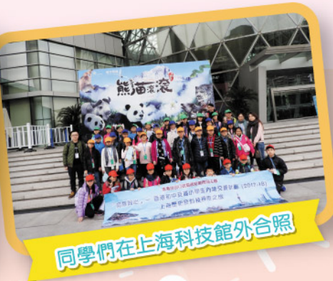
同學們在上海科技館外合照