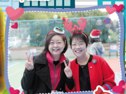
The teachers look cute in their unique hairbands.