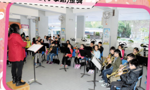
銅管樂隊校內聖誕報佳音表演