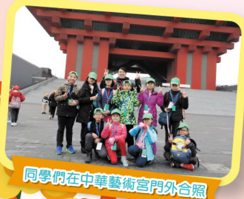
同學們在中華藝術宮門外合照

五年級39位同學於2017年11月30日至12月2日期間參加了上海歷史及科技探索之旅。在三天的遊歷過程中，同學們參觀了上海的不同景點，包括上海科技館、上海外灘、上海博物館、上海城市規劃展示館、東方明珠廣播電視塔、田子坊和中華藝術宮等，從中認識了上海的科技發展，了解到科技與日常生活的關係。同學又從認識上海的歷史、文化和古今中外的建築，了解了上海在過去一百年間的變遷。整個行程中，同學們最感興奮的要算是參觀閔行區實驗小學春城校區。同學們能與當地學生進行學習活動和集體遊戲，促進了兩地同學的友誼及文化交流，有助了解兩地學生的校園生活異同。是次上海之旅，不但讓學生從歷史、文化、建築及科技發展等方面，認識香港和上海的異同，同時也藉此提升了學生的自學能力、社交能力和自理能力，參與的同學實在獲益良多。