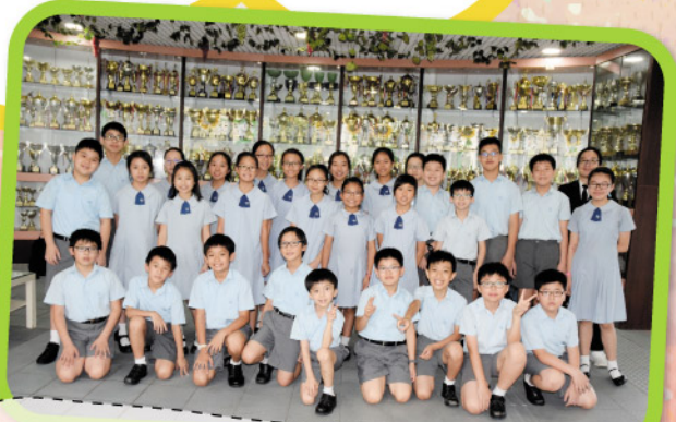
敲擊樂隊榮獲香港學校音樂節敲擊樂高級組季軍及 聯校音樂大賽2018敲擊樂團(小學組)金獎