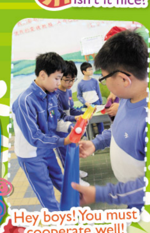
Hey boys! You must cooperate well!