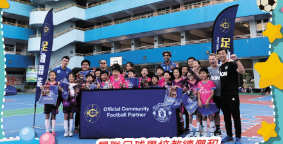
曼聯足球學校教練們和 青衣主恩足球隊大合照

經過一個學期的交流，無論教練和同學，都得到寶貴的學習及經驗，期望他們能將當中的得著好好發揮，展現出非凡的青衣主恩足球精神。