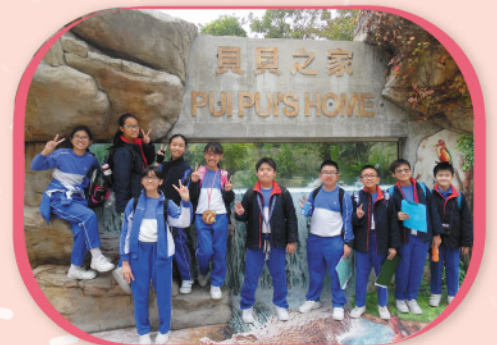
六年級同學在貝貝之家外合照