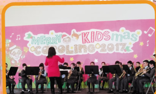
銅管樂校外商場表演