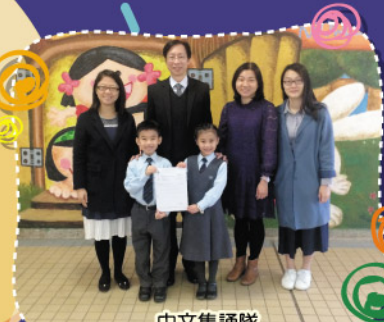
中文集誦隊 中文粵語散文集誦亞軍