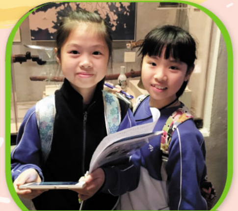
四年級同學在歷史博物館記錄昔日香港生活的資料