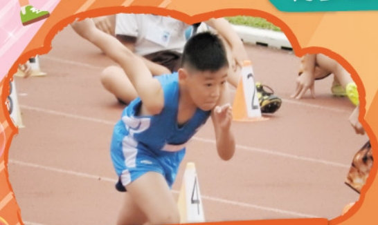
讓我展現出更快更強