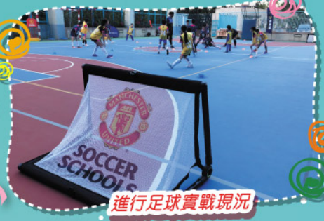
進行足球實戰現況