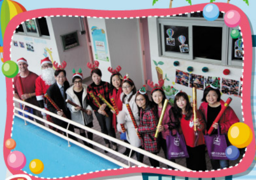
Look! The principal and teachers are ready for the opening ceremony!

The feedback from students was great and positive, in which all the activities could encourage them to participate actively in an authentic English learning environment. We deeply appreciate the kind help and support from all teachers, parents and students. We hope our students can enjoy and love English, as it is the cornerstone of communicating and connecting people around the world.