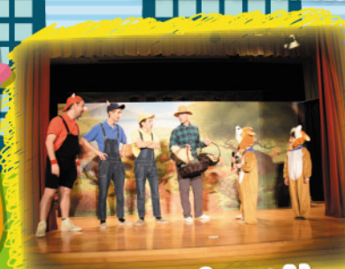
What an unforgettable experience to be on stage with the professional actors!