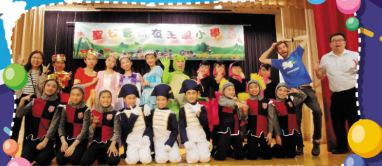
英語話劇組憑The Frog Prince獲香港學校戲劇節「評判推介演出獎」及全體學生獲傑出演員獎

本校積極培育學生演說技巧與發揮學生的演藝天份，每年都鼓勵學生參與各項公開比賽，例如朗誦比賽、話劇比賽及說故事比賽。學生不但表現卓越、屢創佳績，更展現才藝兼備的一面。