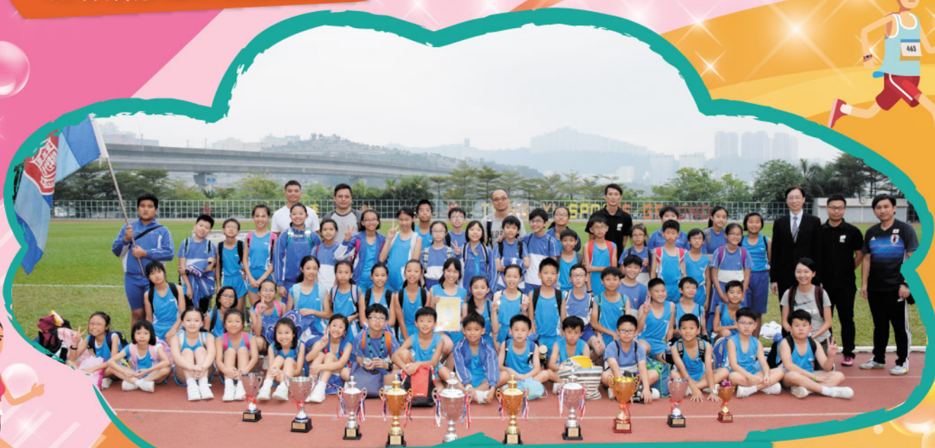
青衣主恩田徑隊健兒展示努力的成果