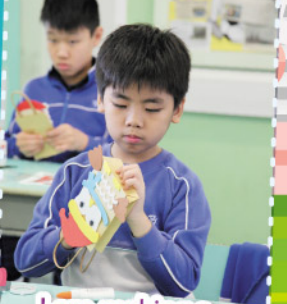
I am making a Christmas gift bag for my friend. Isn't it nice?