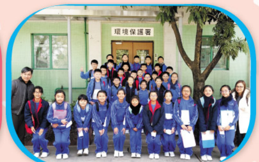
五年級同學參觀新界西堆填區