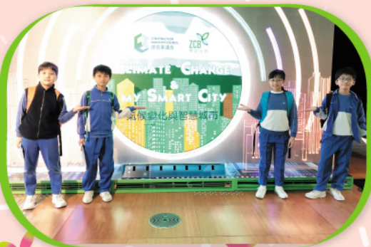
五年級同學參觀零碳天地的氣候變化與智慧城市的展覽