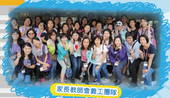
家長教師會義工團隊

校運會能夠圓滿成功，實在要感謝天父的恩典和教師團隊及家長義工團隊的協助。期望校運會能推動學生積極參與運動，鍛煉體魄，保持身體健康，並享受運動的樂趣。