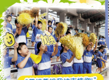
“黃組黃組我地支持你!”