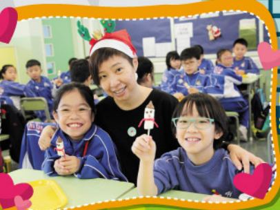
Do you want to try our marshmallow snowmen?